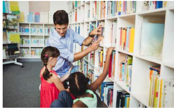
6. De leerlingen gaan elke week naar de ....