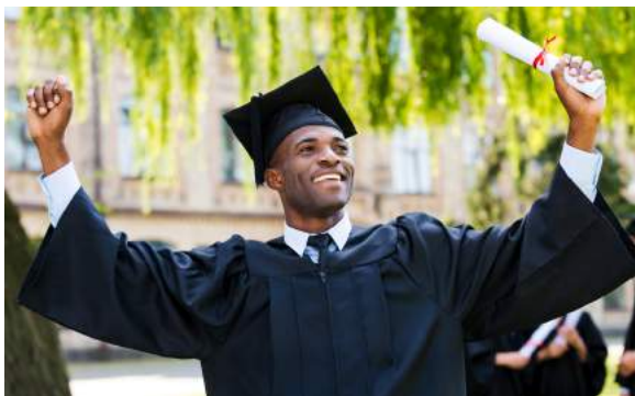
1. De man...