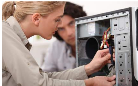
6. De vrouw...