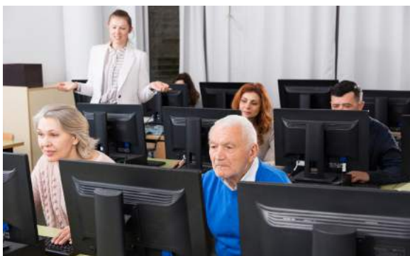
3. De mensen...