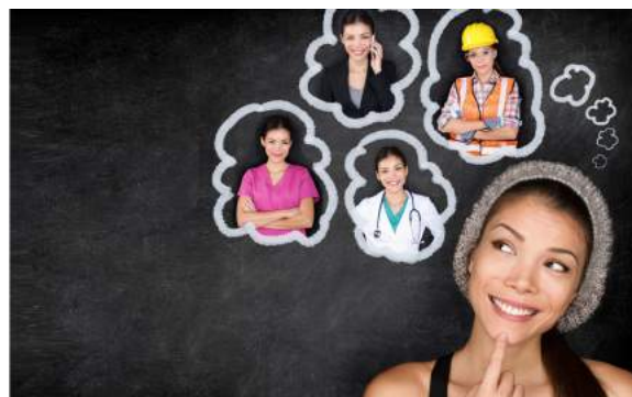
4. De vrouw...