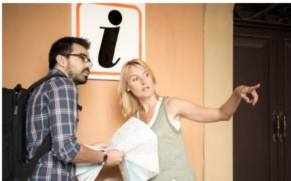
5. De man ...