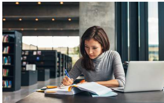
2. De vrouw...