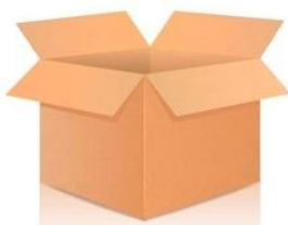
de d oos